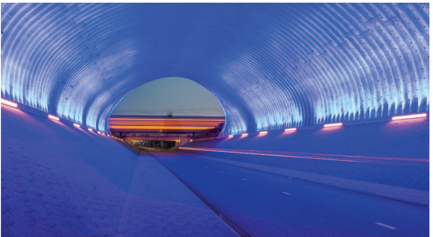
DE FIETSKATHEDRAAL MAAKT DE ALLEDAGSE FORENS VOOR EVEN TOT RUIMTEREIZIGER