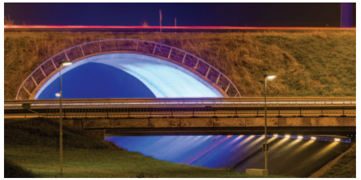
BIJ HET VALLEN VAN DE AVOND VERSCHIJNT EEN BIJZONDER LICHTOBJECT