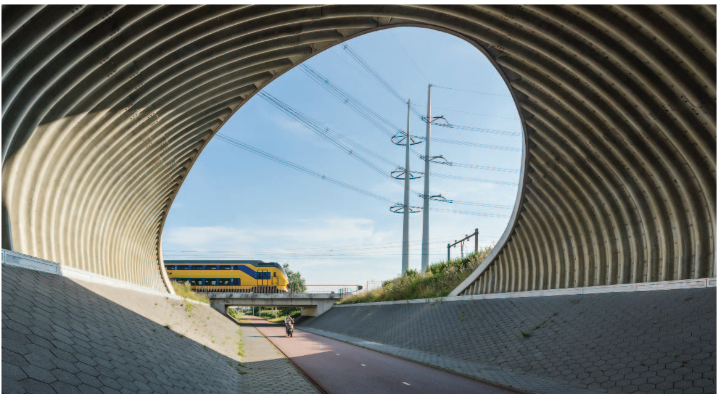
DE GEWELFDE DOORSNEDE KADERT DE DYNAMISCHE OMGEVING OP VERRASSENDE WIJZE

BLAUW LICHT Bij het vallen van de avond krijgt het bijzondere ruimtelijke karakter van de Fietskathedraal nog een extra dimensie. Het verzinkt stalen gewelf wordt aangelicht met een eenvoudige, blauwe ledverlichting, verborgen in de bovenrand van de verdiepte passage. Het licht kleefde als het ware aan de gebogen doorsnede met een even spectaculair als feestelijk effect, een mysterieus lichtobject in het banale snelweglandschap dat de alledaagse fietsforens voor een kort moment tot ruimte reiziger maakt.