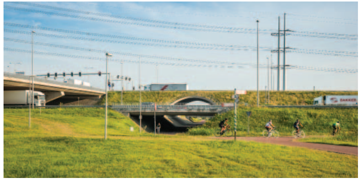
DE FIETSKATHEDRAAL VOEGT ZICH IN EEN COMPLEX EN GELAAGD INFRALANDSCHAP

ROUTEONTWERP De A12 is de eerste – bestaande – Rijksweg die in zijn volledige lengte als ontwerppoging is opgevat, van het Haagse Malieveld tot de Duitse grens bij Zevenaar. In samenspraak met meerdere ontwerpers is een 'routeontwerp' ontwikkeld dat een aantal ontwerppuntgangspunten formuleert en een catalogus van oplossingen biedt, specifiek voor de A12. Afhankelijk van het onderdeel stuurt het routeontwerp aan op eenheid, verwantschap, of geregisseerd verschil. Hoe dichterbij de middenberm, hoe meer eenheid in het wegontwerp. Onderdoorgangen onder de snelweg kunnen daarentegen juist een meer lokaal en individueel karakter krijgen. De fietskathedraal bij Bleiswijk is hiervan een pregnante voorbeeld.