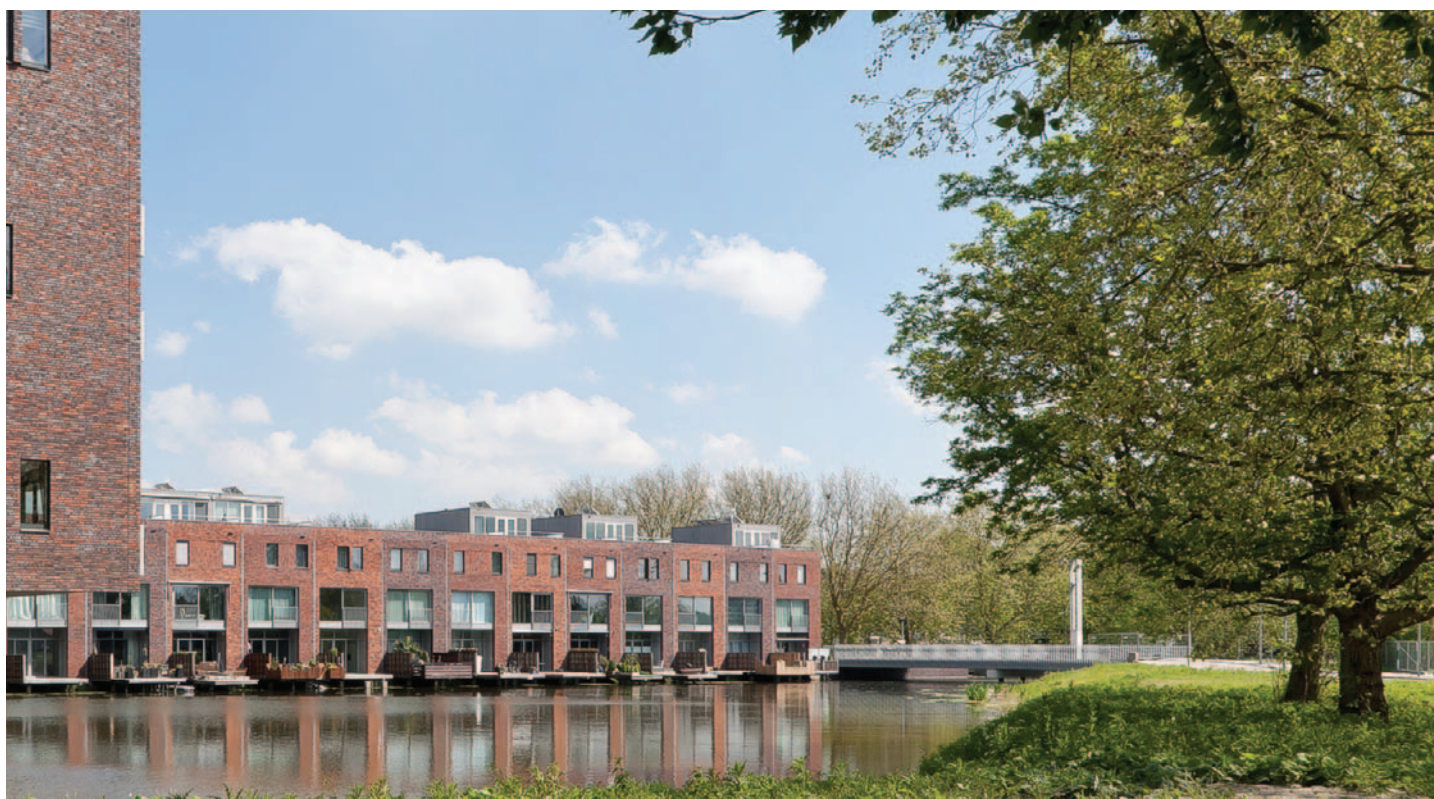
DE WESTELIJKE BRUG MAAKT ONDERDEEL UIT VAN HET PARKVENSTER-ENSEMBLE

VERTICAAL BAKEN EN VITRAGE Het ontwerp van de bruggen wordt gekenmerkt door een eenvoudige belijning die aansluit bij de heldere opzet en vormgeving van de nieuwe buurt. De symmetrie van de twee asymmetrisch geprofileerde bruggen benadrukt hun functie als ruimtelijk kader van het eiland. Een monumentale 'lichtzuil', gekoppeld aan de middenondersteuning, verlicht de westelijke brug (de oostelijke is vooralsnog niet gerealiseerd) op een bijzondere manier vanuit één punt en markeert als verticaal baken de entree tot de buurt, zowel overdag als 's avonds. In de dwarsrichting – de richting van het doorzicht op het Park – is gestreefd naar een maximale transparantie door middel van een minimum aan ondersteuning bij de gegeven overspanning. Een bijzonder lamellenhekwerk van ovale buisprofielen fungeert als de vitrage van het Parkvenster.