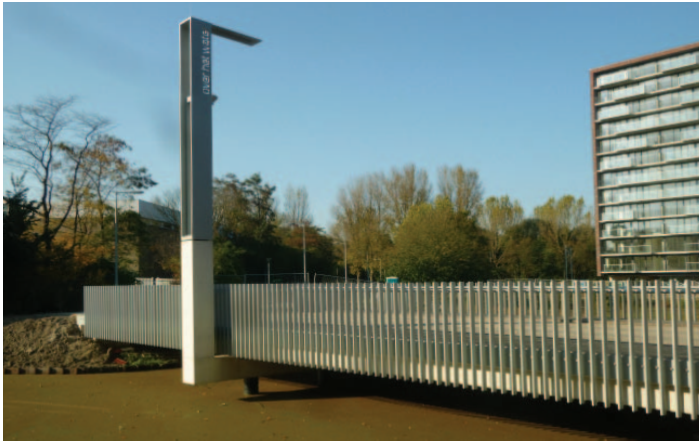
HET BIJZONDERE LAMELLENHEKWERK WERKT ALS SUBTIELE VITRAGE IN HET PARKVENSTER