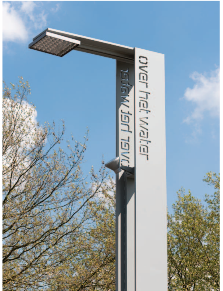
DE MONUMENTALE LICHTZUIL FUNGEERT ALS VERTICAAL BAKEN