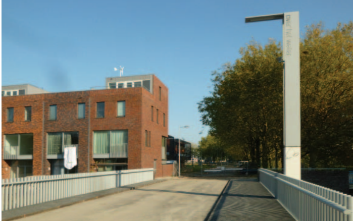
DE BRUG ALS BUURTENTREE