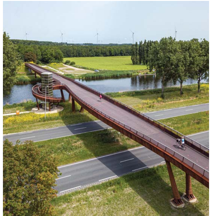
DE BRUG ALS LANDSCHAP

De doorsnede heeft een vergelijkbare, subtiel meanderende vorm. Het deel van de brug dat de verkeersweg overspant is enigszins opgetild, terwijl het deel dat het kanaal overspant transparanter oogt en iets naar beneden duikt. De verschillende hoogten corresponderen met respectievelijk de vereiste doorrijhoogte van de rijbaan en de vereiste doorvaarhoogte van het kanaal. Het brugdek zelf vormt overigens één vloeiende, doorgaande lijn. De meandervorm wordt gegenereerd door te variëren met de hoogte van de randligger.