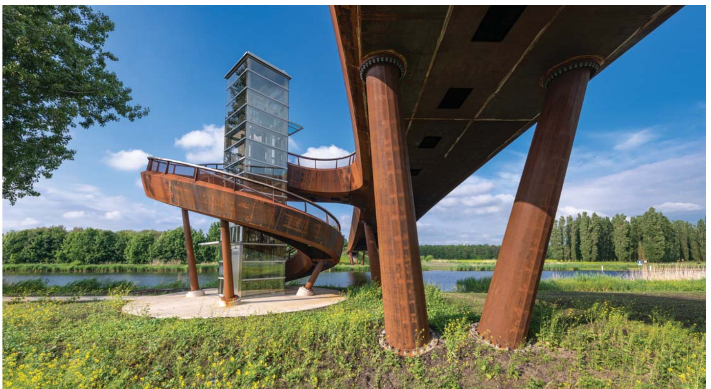
DE SPILTRAP EN DE LIFT WAAR HIJ ZICH OMHEEN WINDT, ONTSLUITEN DE BUSHALTE TUSSEN DE VAART EN DE WEG