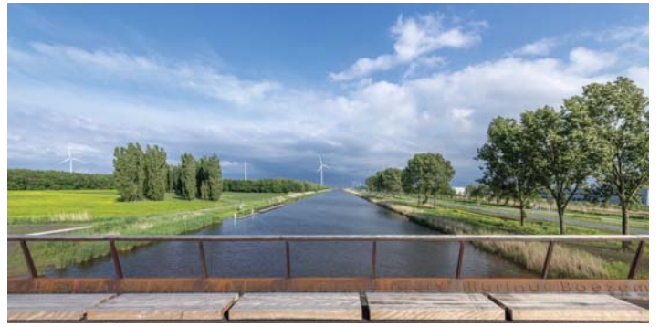
NIEUW PERSPECTIEF OP DE GROENE KATHEDRAAL