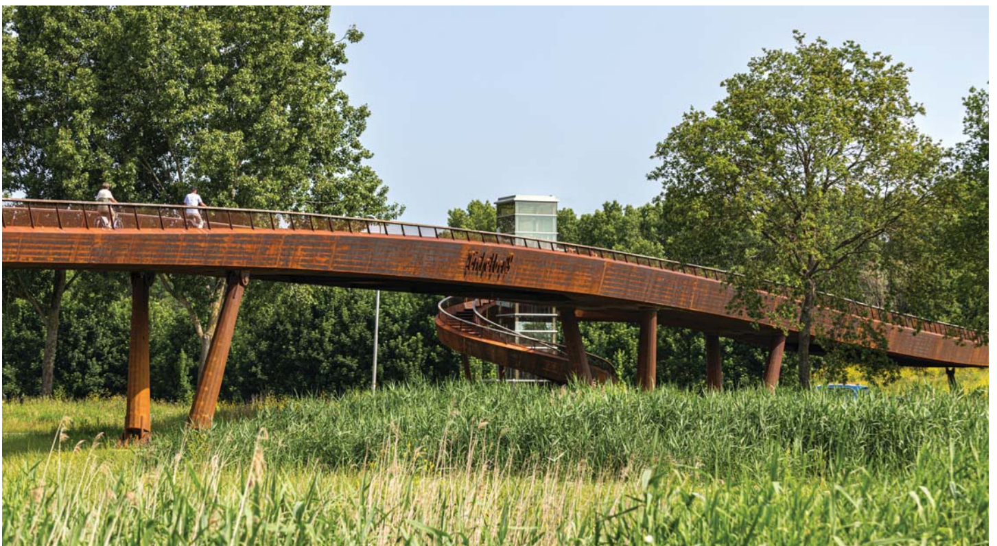
EEN POORT VOOR ALMERE