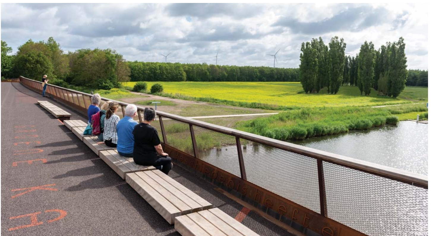
BOVEN DE VAART TRANSFORMEERT DE BRUG IN EEN LANGGEREKTE ZITBANK DIE EEN UNIEK ZICHT OP DE GROENE KATHEDRAAL BIJDT