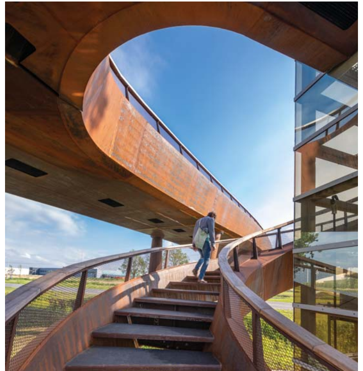
DE SPILTRAP IS IN ÉÉN VLOEIENDE BEWEGING UITGEVOERD

DE BRUG ALS LANDSCHAP De bouwlocatie bevindt zich op de grens van polder en bos. Aan de zuidzijde sluit de brug aan bij de rechtlijnigheid van het polderlandschap. Aan de noordzijde schrijft de brug zich met ronde vormen in het bosgebied in. In de plattegrond bemiddelt de brug tussen beide gebieden. Het strenge, rechte zuidelijke deel transformeert geleidelijk, via twee vloeiende uitstulpingen, naar een spiraalvorm op de boomrijke noordoever.