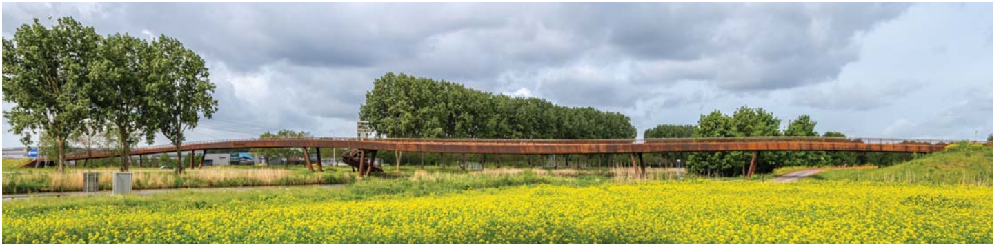
HET WEERVASTSTAAL PAST OP NATUURLIJKE WIJZE IN DE KLEURSCHAKERINGEN VAN DE LOCATIE

De doorsnede heeft een vergelijkbare, subtiel meanderende vorm. Het deel van de brug dat de verkeersweg overspant is enigszins opgetild, terwijl het deel dat het kanaal overspant transparanter oogt en iets naar beneden duikt. De verschillende hoogten corresponderen met respectievelijk de vereiste doorrijhoogte van de rijbaan en de vereiste doorvaarhoogte van het kanaal. Het brugdek zelf vormt overigens één vloeiende, doorgaande lijn. De meandervorm wordt gegenereerd door te variëren met de hoogte van de randligger.