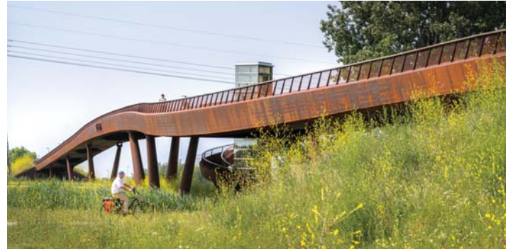
EEN BRUG MET EEN HEUVEL EN EEN VALLEI

LOCATIE Als invalsroute naar Almere voert de Waterlandseweg langs een aantal iconische objecten en bijzondere locaties, zoals de Groene Kathedraal, het monument voor de Founding Fathers, Kasteel Almere, het Cirkelbos en het Floriadeterrein. De nieuwe brug over deze weg heeft daarmee de kans om zichzelf als een soort stadspoort te manifesteren. Door te verwijzen naar de attracties die zich in zijn nabijheid bevinden wint de brug – en de locatie – aan betekenis. De brug wordt een aankondiging van de stad en een teken van de aanwezigheid van de andere bijzondere plekken.