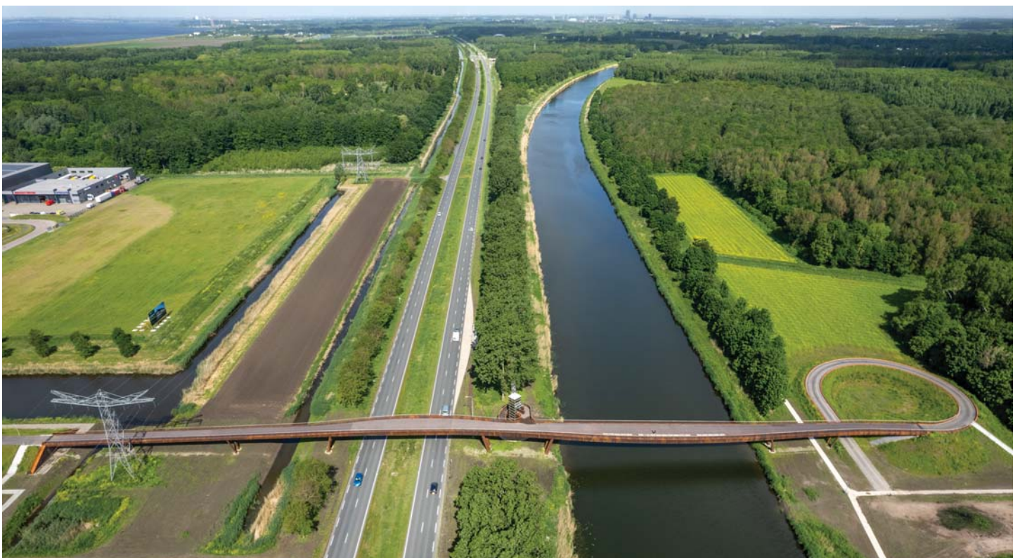
DOOR KENMERKEN VAN HET LANDSCHAP OVER TE NEMEN WORDT DE BRUG ZELF EEN LANDSCHAP. DE AANLANDING OP DE NOORDOEVER IS EEN STILLE VERWIJZING NAAR HET SPIRAALVORMIGE PAD VAN ALMERE BOVEN, DAT LEIDT NAAR HET DERTIG METER HOOG GELEGEN MONUMENT VOOR DE FOUNDING FATHERS