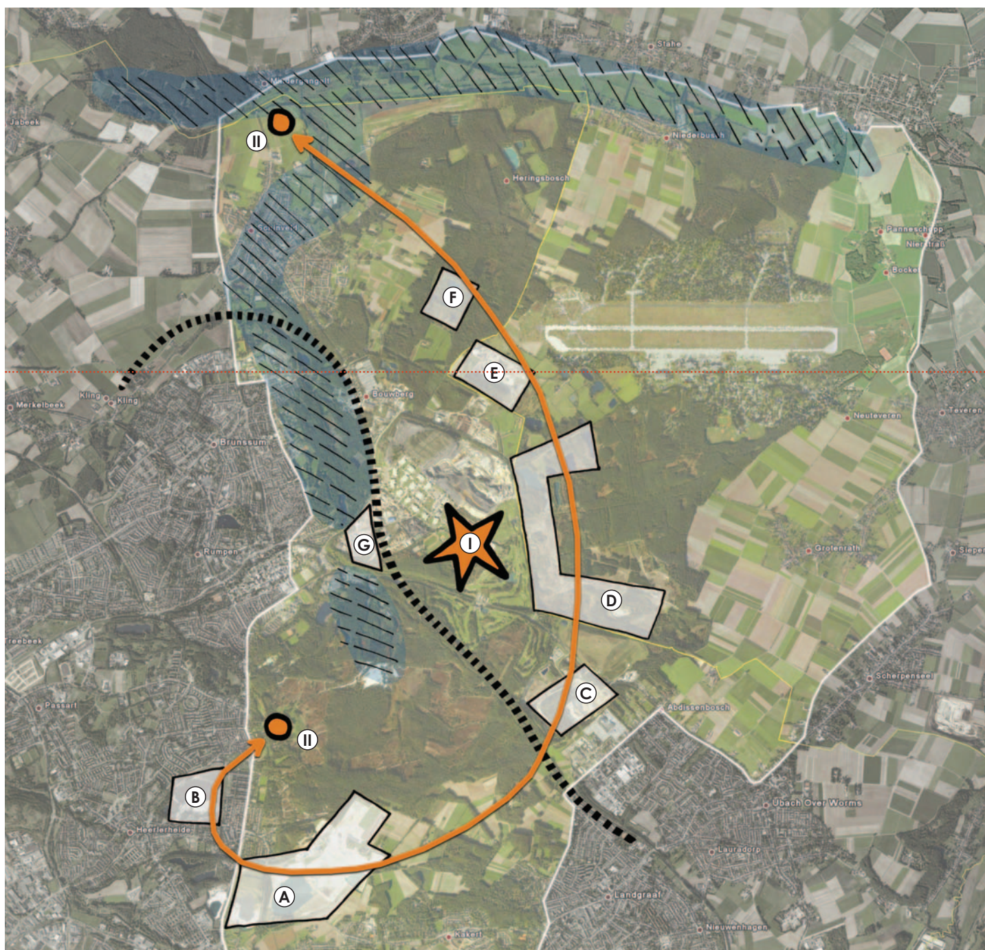
VERBINDEN VAN HISTORISCHE MIJNBOWGEBIEDEN

De vier nu separaat liggende natuurgebieden worden met elkaar verbonden, zodat planten en dieren zich weer kunnen verspreiden. Om deze doelen te bereiken is een internationale samenwerking nodig tussen overheden, natuurbeheerders en bedrijven.