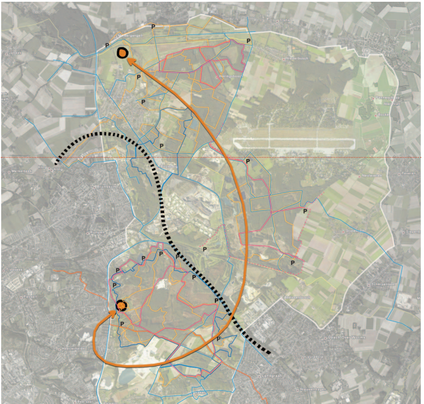
NETWERK VAN VAN WANDEL-, FIETS- EN RUITERPADEN

Hierbij is ingezet op het verbinden van de gebieden tot één samenhangend robuust natuurpark met daarbinnen een heldere zonerings tussen natuur en recreatie. Daarnaast is een netwerk ontwikkeld tussen de verschillende cultuurhistorisch waardevolle mijnbouwgebieden dat in recreatieve zin een belangrijke economische impuls voor het gebied kan gaan betekenen.