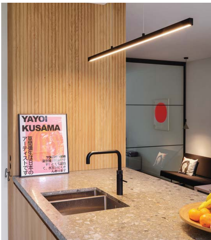
HET 'KEUKENEILAND' IS VOORZIEN VAN EEN AMBACHTELIJK TERAZZO AANRECHTBLAD