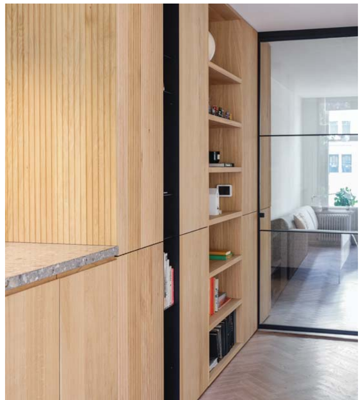
EEN OP MAAT GEMAAKTE KASTENWAND VAN MASSIEF HOUTEN PANELEN, GECOMBINEERD MET VERTICALE VAKKEN IN ZWART STAAL