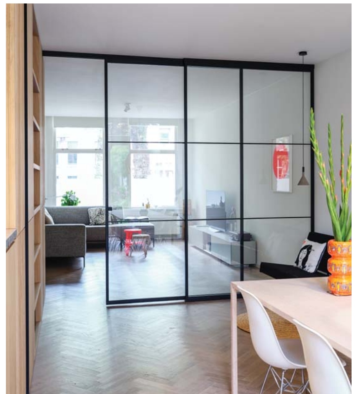
EN STALEN ZWARTE SCHUIFPUI TUSSEN WOON- EN EETGEDEELTE, EIGENTIJD'S 'EN SUITE'