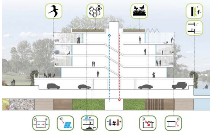
SCHEMA VAN DE MAATREGELEN TEN AANZIEN VAN DUURZAAMHEID EN ECOLOGIE

Tuinen en architectuur delen dezelfde vormtaal van vloeiende lijnen en topografische hoogteverschillen. Golvende gazons lopen door tot aan de gevel; gebogen beukenhagen benadrukken continuïteit. Toch hebben de verschillende domeinen ieder een ander karakter. De tuin van het Hoofdgebouw is van een speelruimte voorzien. De Bosvilla Noord kan als een 'hortus conclusus' worden getypeerd en de Bosvilla Zuid is op het water gericht.