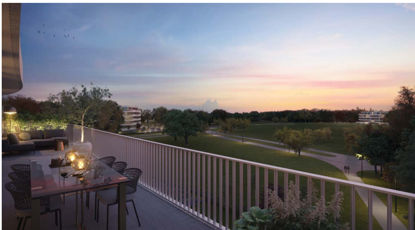
ALLE APPARTEMENTEN GENIETEN VAN ROYALE BALKONS OF TERRASSEN MET EEN PRACHTIG UITZICHT