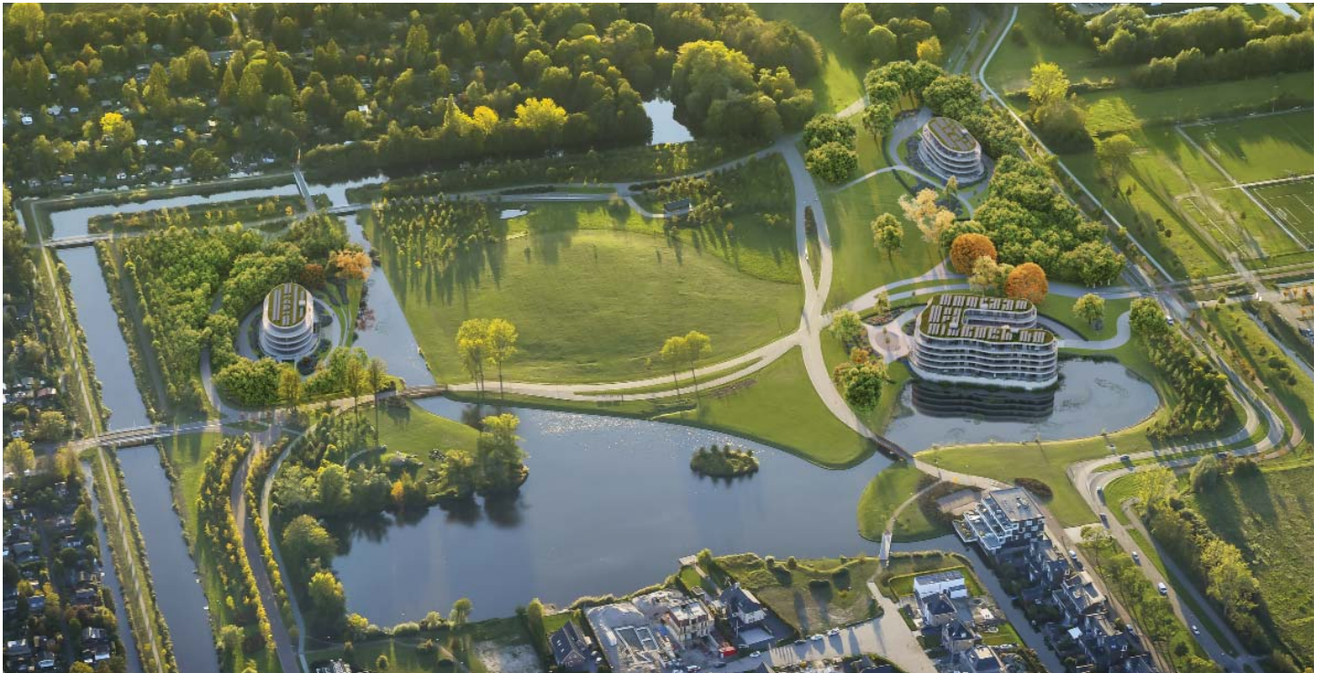
MET ZIJN RONDE VORMEN MAKEN DE HOVEN ONDERDEEL UIT VAN HET ENGELSE PARKLANDSCHAP