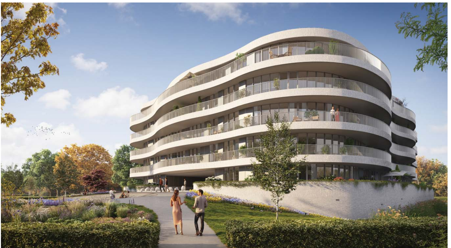
MET 41 APPARTEMENTEN IS HET 'DE ORANJERIE' DE GROOTSTE VAN DE 3 GEBOUWEN