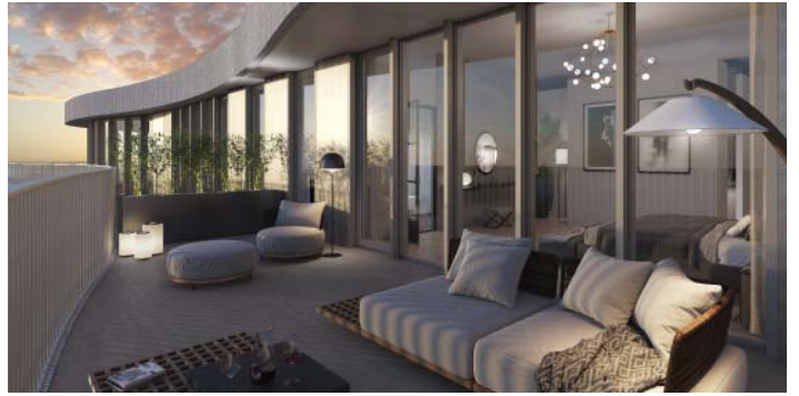
DE GROTE TERRASSEN WORDEN EEN VERLENGING VAN DE WONING