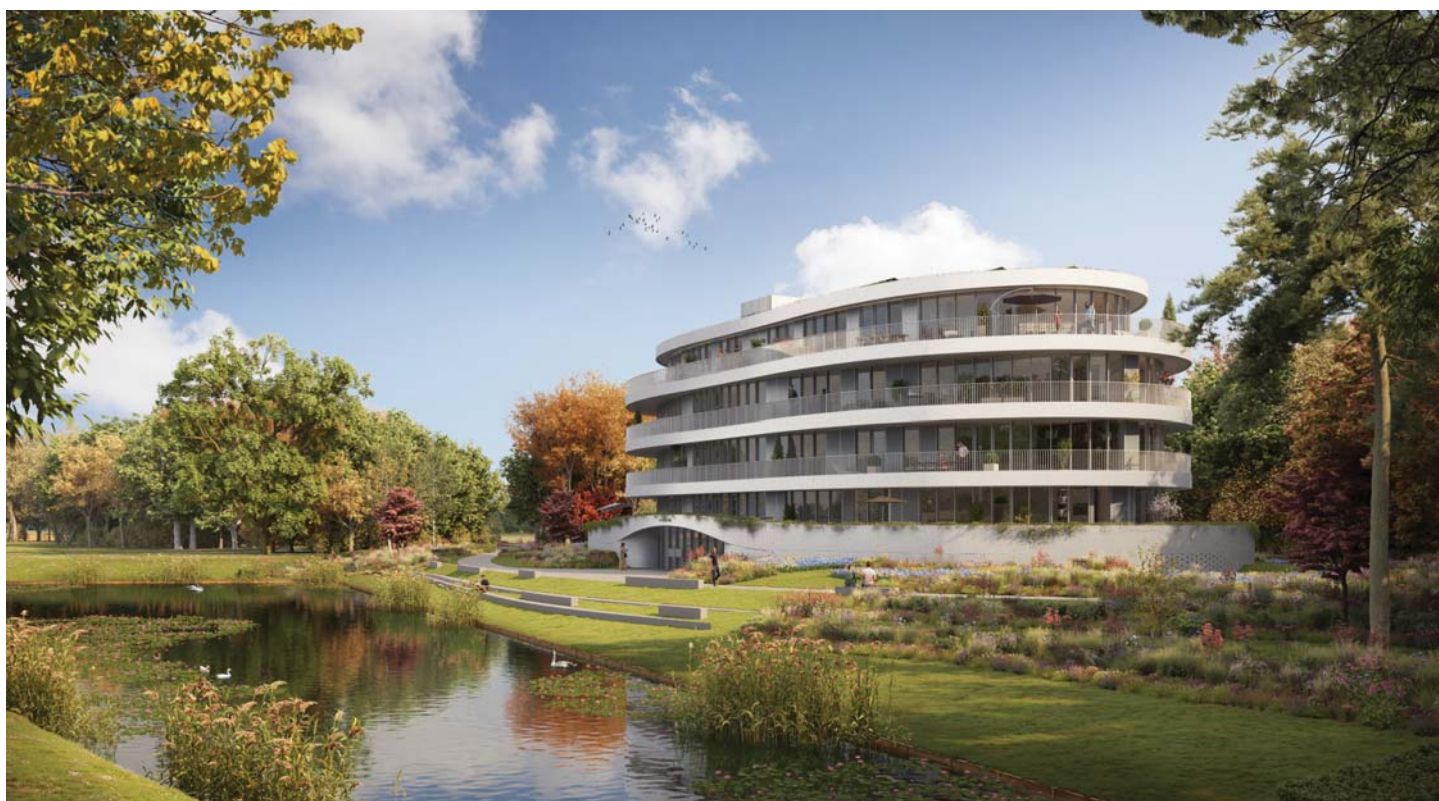
DE APPARTEMENTENVILLA'S HEBBEN EEN ORGANISCHE VORMGEVING, GEKENMERKT DOOR EEN ALZIJDIG EN EENDUIDIG KARAKTER

De gebouwen zijn van een bijzondere plint voorzien. De plint zorgt voor privacy van de bewoners en voorkomt een onrustig beeld door de buitenruimtes van de eerste woonverdieping op te tillen. In de plint worden alle noodzakelijke voorzieningen, zoals bijvoorbeeld trafo's, bergingen en fietsenstallingen, inpandig opgelost. De plint gaat naadloos over in het landschap en wordt in Braziliaans verband gemetseld. Op deze manier wordt de garage van natuurlijke ventilatie en daglicht voorzien en tegelijkertijd de plint met een speels patroon van openingen verrijkt.