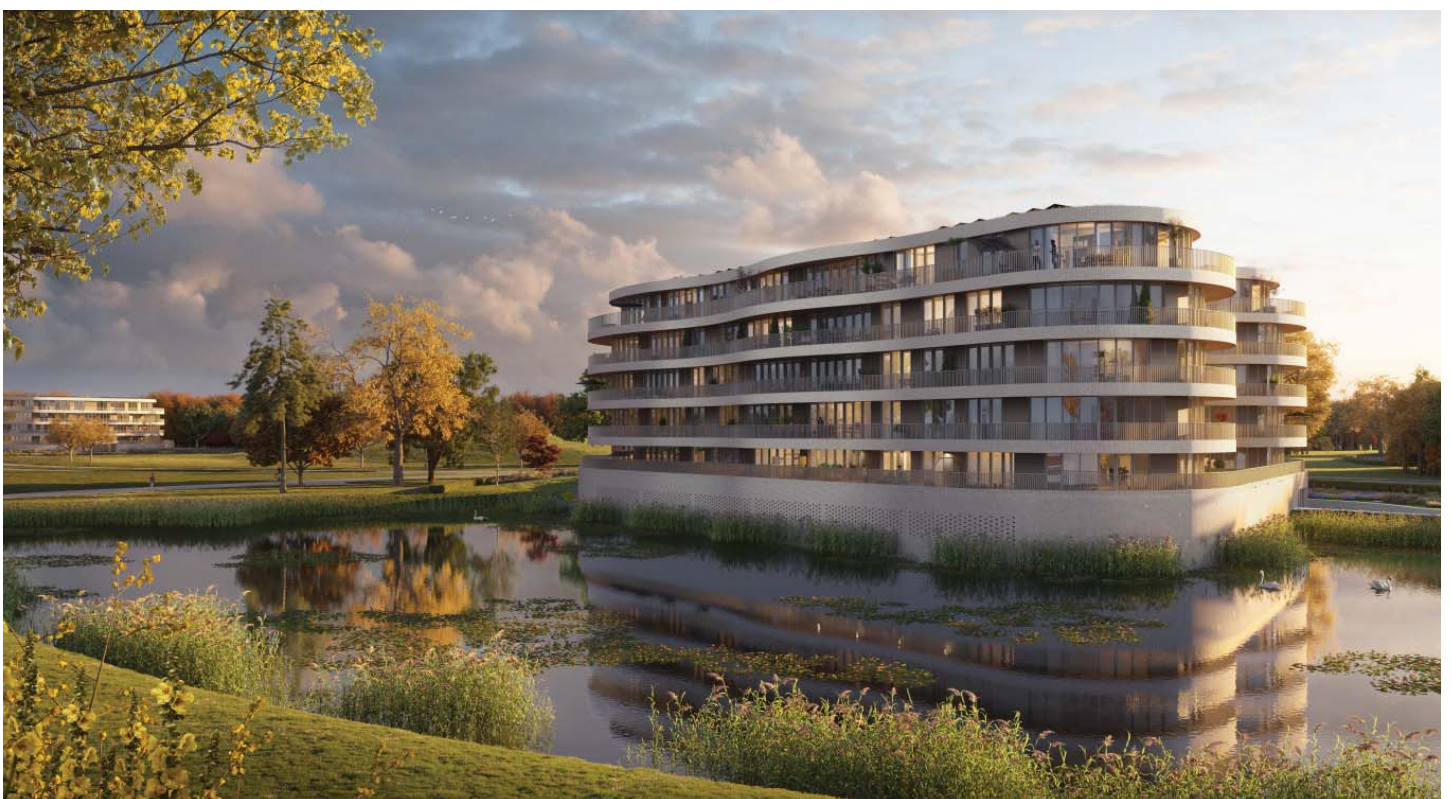
ZOALS EEN BUITENPLAATS STAAT DE ORANJERIE ALS EEN ICOON OP DE AS VAN DE VAN DER DUIJN EN VAN MAASDAMWEG