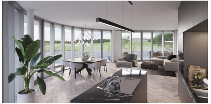
DE PANORAMISCHE UITZICHTEN OVER HET PARK ZIJN KENMERKEND VOOR ALLE WONINGEN