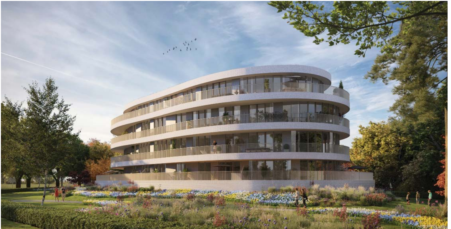
HET KOETHUIS LIGT MIDDEN IN HET PARK EN BESTAAT UIT 12 APPARTEMENTEN EN 3 PENTHOUSES