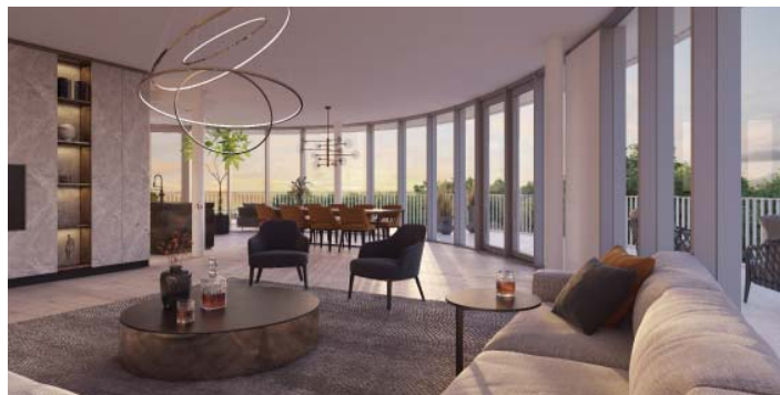
DE VLOER TOT VLOER PUIEN VERSTERKEN DE RELATIE TUSSEN DE APPARTEMENTEN EN HET PARK