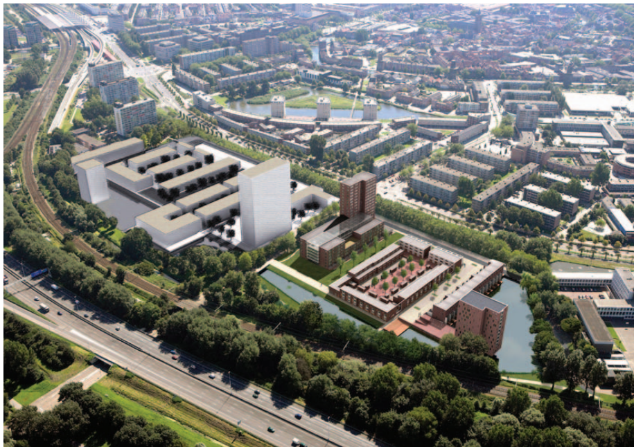
HET SPVE 2005 COMBINEERDE EEN GROEN KARAKTER MET STEDELIJKE DICHTHEID