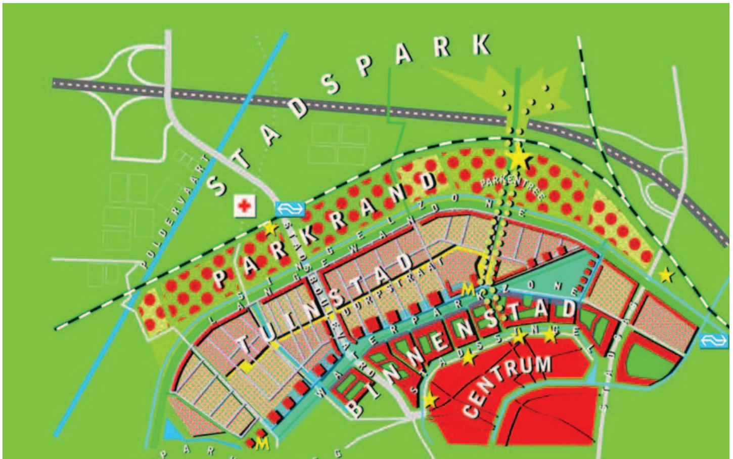
DE STRATEGISCHE KAART DEFINIEERT DRIE SCHILLEN MET EEN EIGEN RUIMTELIJK KARAKTER BINNEN DE WIJK NIEUWLAND

SCHILLEN wUrcK is sinds het begin van deze eeuw betrokken bij de stedelijke herstructurering van Nieuwland, een van de meest grootschalige opgaven binnen Schiedam. Als eerste aanzet is een Strategische Kaart ontwikkeld die richting en samenhang geeft aan de herstructureringsopgave voor de hele wijk en het plaatselijk reeds in gang gezette differentiatieproces. De Kaart speelt in op latent aanwezige verschillen in de stedenbouwkundige structuur en bouwt deze bewust verder uit. Binnen het geheel van de wijk definieert de Strategische Kaart een drietal concentrische 'schillen'. De schillen – ingeklemd tussen het historisch centrum van Schiedam en het Beatrixpark – verschillen in hun positie en ruimtelijk karakter: de Binnenstad, de Tuinstad en de Parkrand. Dit gelaagde model vormt de onderlegger voor het realiseren van nieuwe en vernieuwde woonmilieus. Binnen iedere schil bevinden zich zowel te renoveren als sloop & nieuwbouw-gebieden en worden nieuwe woningtypen en -categorieën geïntroduceerd naast behoud van bestaande goedkope voorraad.