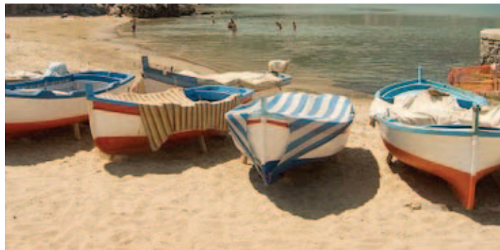
'ALS BOTEN OP HET STRAND'

PARKRAND Parkweg Noord is een van de 'speerpuntgebieden' binnen de herstructureringsopgave. De buurt maakt deel uit van de Parkrand, een reeks van in het groen ingebedde woonenclaves tussen de brede Van Haarensingel en de spoorlijn, met daarachter het Beatrixpark. De Parkweg vormt de hartlijn van de buurt en is een belangrijke stedelijke toegang tot het park. In afweging met de aanpak van geheel Nieuwland is er hier voor gekozen de bestaande bebouwing volledig te vervangen. De bestaande monumentale groenstructuur wordt zoveel mogelijk behouden. Het ontworpen plan vormt een radicale breuk met de bestaande woonstrokenverkaveling.