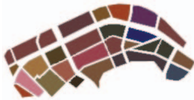
STATUS QUO: LAPPENDEKEN