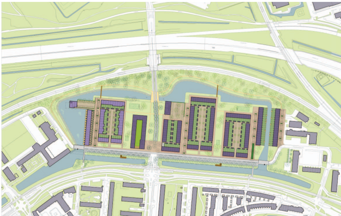
HET STEDENBOUWKUNDIG PLAN VOOR OVER HET WATER VORMT EEN RADICALE BREUK MET DE BESTAANDE STROKENVERKAVELING VAN PARKWEG NOORD

PROCES De Strategische Kaart is in 2005 vertaald in het herziene bestemmingsplan voor Nieuwland. Op basis van het Stedenbouwkundig PVE van 2005 is het westelijk deel van het Over het Water gerealiseerd, onder meer met de door wUrcck ontworpen Kadewoningen en Watertoren. Binnen het ontworpen stedenbouwkundig kader is het SPVE in 2011 herzien naar aanleiding van de gewijzigde marktomstandigheden, met een groter aandeel eengezinswoningen. Hierbij zijn twee varianten ontwikkeld die verschillen voor wat betreft de invulling langs de Parkweg: een 'stedelijke' variant met deels gestapelde woningen en een 'ontspannen' model volledig gebaseerd op laagbouw.