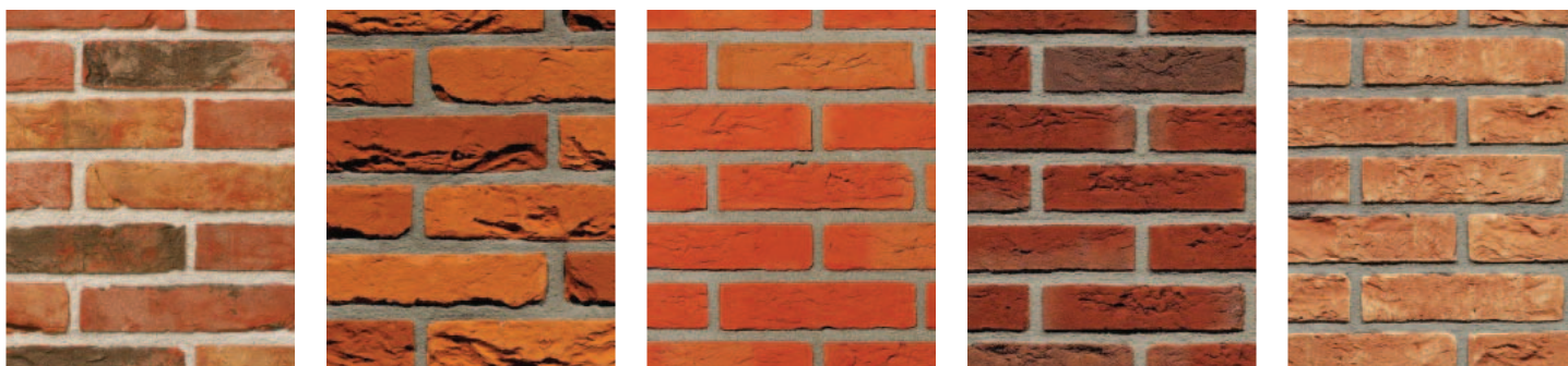
EEN WARM PALET MET EEN RIJKE SCHAKERING ONDERSTEUNT DE AUTONOMIE VAN DE WOONEILANDEN