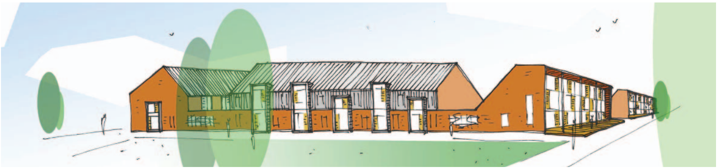
GEDIFFERENTIEERDE WOONEILANDEN MET EEN DUIDELIJKE SCHEIDING TUSSEN PUBLIEK EN PRIVAAT DOMEIN