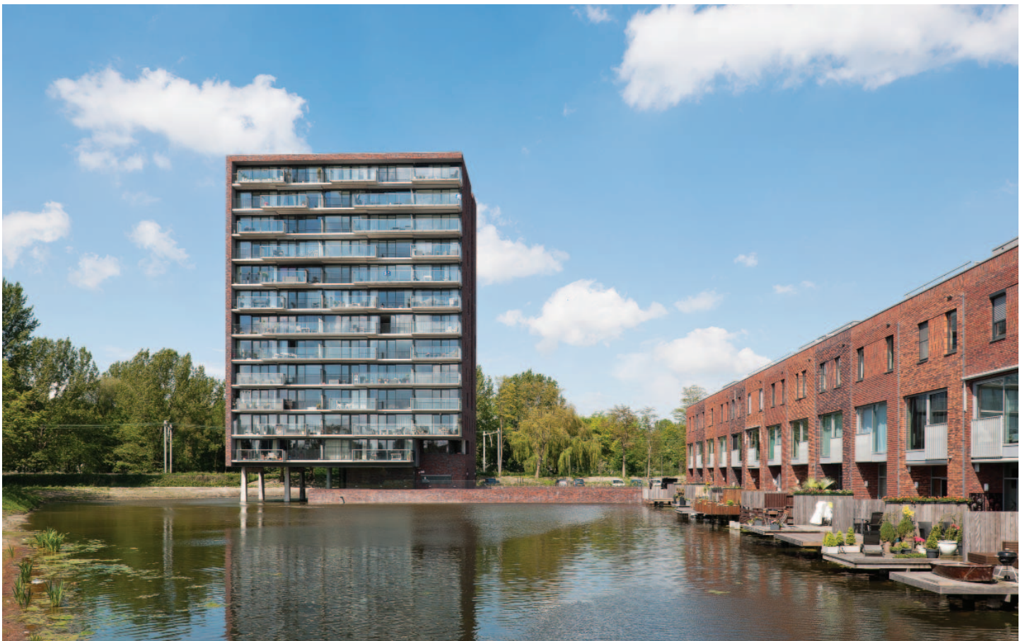
HET ENSEMBLE VAN WATERTOREN EN KADEWONINGEN AAN HET PARKVENSTER GEEFT VORM AAN DE WESTELIJKE BEÏNDIGING VAN HET WOONEILAND OVER HET WATER (2011, ARCHITECT: WURCK)