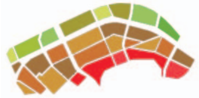
STRATEGIE: GEDIFFERENTIEERDE SCHILLEN

DIVERSITEIT De wijk Nieuwland is in de naoorlogse wederopbouwperiode tot stand gekomen aan wat destijds de rand van Schiedam was. In lijn met de woonbehoeften en de modernistische geest van die tijd werd een wijk gebouwd met voornamelijk portieketagewoningen in een open verkaveling op een monotoon groen tapijt. Het eenzijdige woonprogramma, het saaie beeld en de onduidelijke overgangen tussen openbaar en privédomein hebben de wijk kwetsbaar gemaakt. In samenspraak met de corporatie en de bewoners zet de gemeente daarom in op differentiatie: in woonmilieus en woningaanbod maar ook in een weloverwogen mix van renovatie en sloop/nieuwbouw. De aantrekkelijke kwaliteiten die de wijk ook kent, zoals de inmiddels centrale ligging in de stad en de rijkelijke aanwezigheid van volwassen groen, vormen het vertrekpunt voor de stedelijke herstructurering.