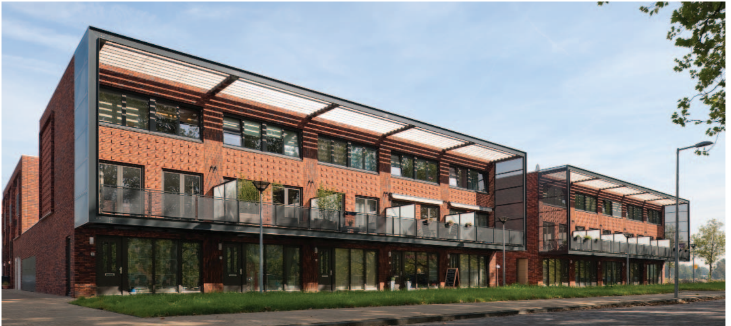
DE OPGETILDE KOP AAN DE SINGELOEVER GEEFT EEN KRACHTIGE EXPRESSIE AAN HET MEWSBLOK (2011, ARCHITECT: KINGMA & VAN MAMEREN)