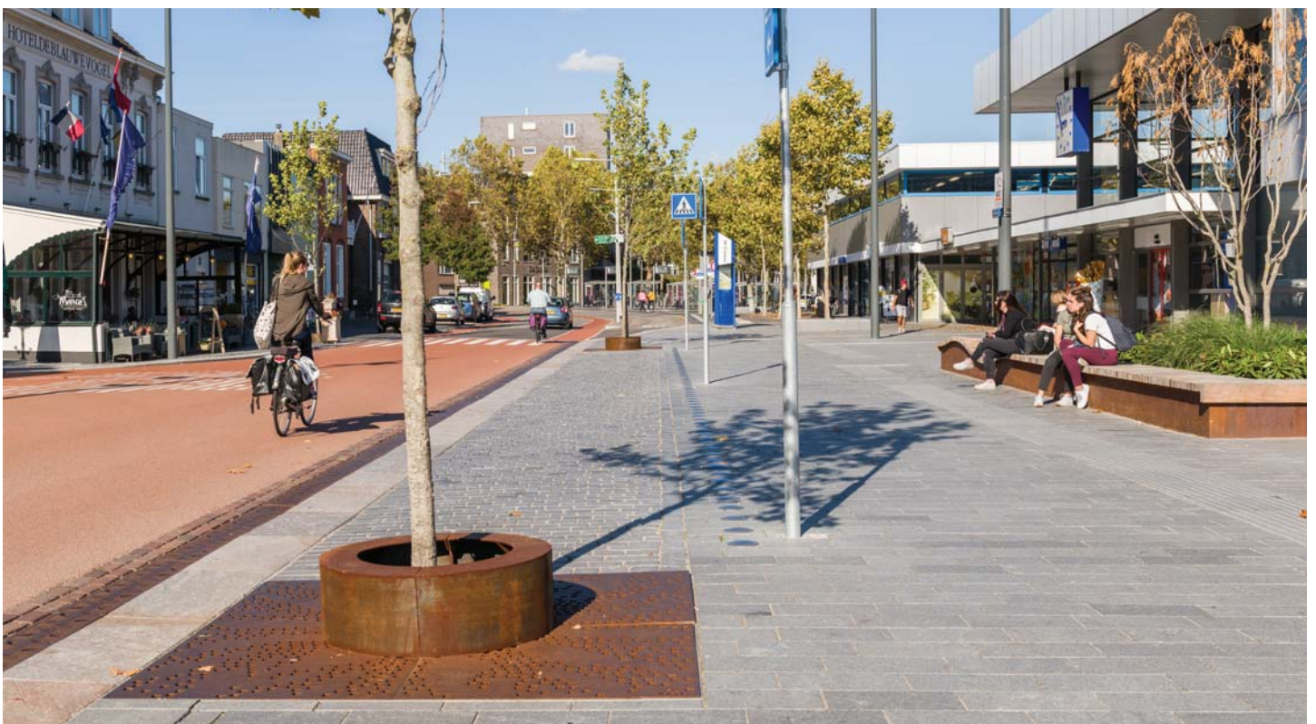
HET GEBRUIK VAN WEERFAST STAAL EN CORTEN GEVEN HET PLEIN EEN EIGEN IDENTITEIT