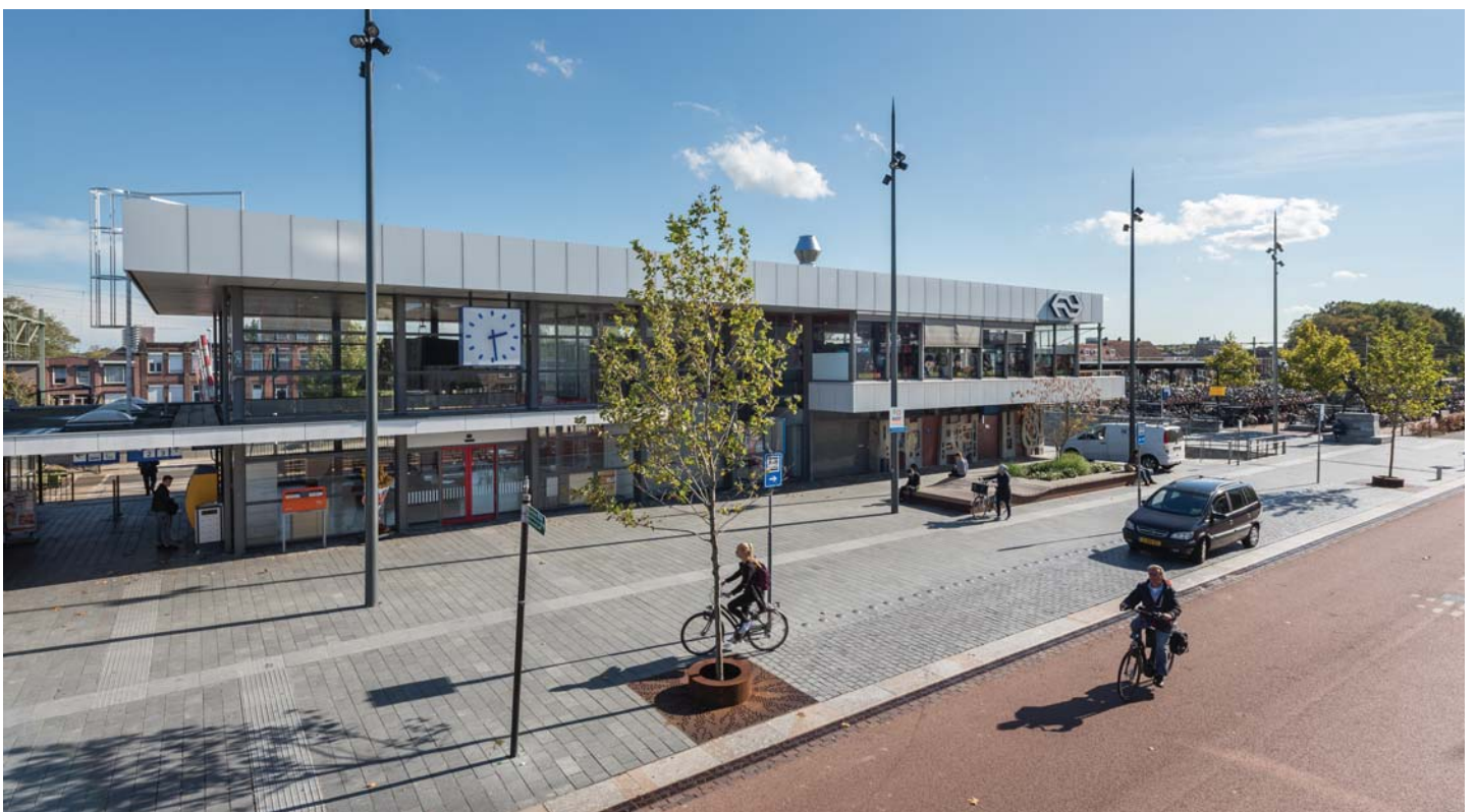
HET PLEIN HEEFT EEN OPEN EN VEILIG KARAKTER