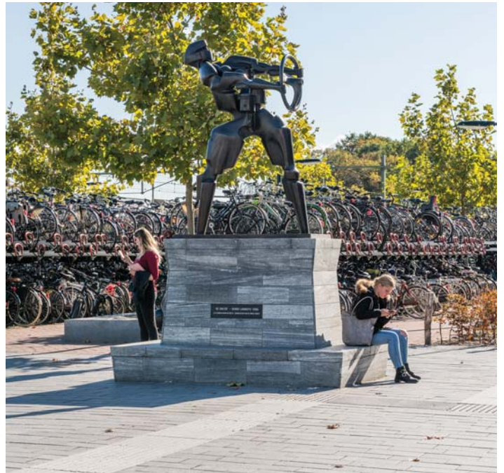
'DE RACER' VAN HENRI LANNOË IS OP EEN NATUURSTENEN SOKKEL GEPLAATST DIE TEGELIJKERTIJD ALS BANK FUNGEERT

Het ontwerp is tot stand gekomen door een intense samenwerking tussen wUrck en de gemeente Bergen op Zoom. De verkeerskundige inbreng van Goudappel Coffeng heeft hierbij een belangrijke bijdrage geleverd aan een gedegen realistisch en maakbaar ontwerp.