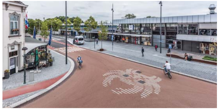
DE 'KRAB' NODIGT DE REIZIGERS UIT

HERINRICHTING De gemeente Bergen op Zoom heeft de afgelopen jaren een flinke slag gemaakt met de herinrichting van het openbaar gebied rond het NS-station. Het Busplein, Zuidoostsingel en Oude Stationsweg zijn enkele jaren terug opnieuw ingericht. De reconstructie van de voetgangerstunnel met de entrees aan de zijde van de Parallelweg en aan de zijde van het Stationsplein samen met de uitbreiding van de fietspleinen zijn ook door wUrck ontworpen.