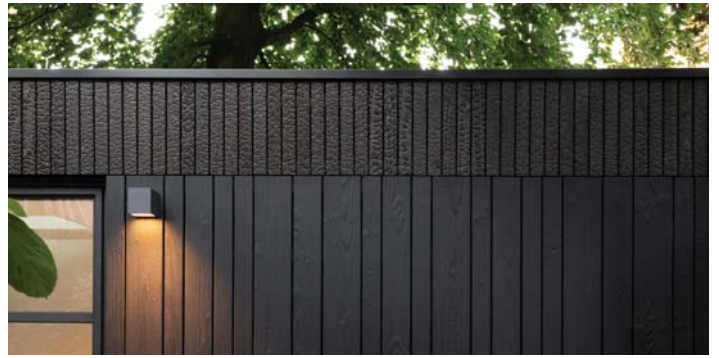
VERBRAND EN GEBEITST DOUGLASHOUT BEPALEN DE SFEER.