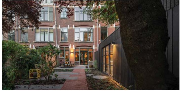
DOOR DE COMBINATIE VAN MATERIALEN WORDEN DE TUIN EN DE BESTAANDE GEVEL ALS ÉÉN GEHEEL ERVAREN.

ARCHITECTONISCH ONTWERP De tuinstudio is zo ontworpen dat het een samenhangend geheel vormt met de schuttingen, die gezamenlijk de tuin definiëren en privacy met de straat waarborgen. De tuinstudio biedt een open ruimte die veelzijdig kan worden ingericht als studio, slaapkamer of voor andere gebruiksfuncties. Daarnaast is het voorzien van een badkamer en een berging, waardoor het een complete en functionele ruimte biedt. De algemene ruimte wordt verlicht door een hoge stalen pui en een daklicht, die zorgen voor een overvloed aan daglicht en een open, luchtige sfeer creëren. De gevels van de tuinstudio zijn vervaardigd uit Douglas-hout, dat op drie verschillende manieren is behandeld. Aan de tuinzijde zijn de latten zwart verbrand of gebeitst met planken van verschillende afmetingen, terwijl de straatzijde in onbehandelde staat is gelaten. De binnenzijde van de tuinstudio is afgewerkt met witte en lichte tinten, wat bijdraagt aan een frisse en uitnodigende uitstraling.