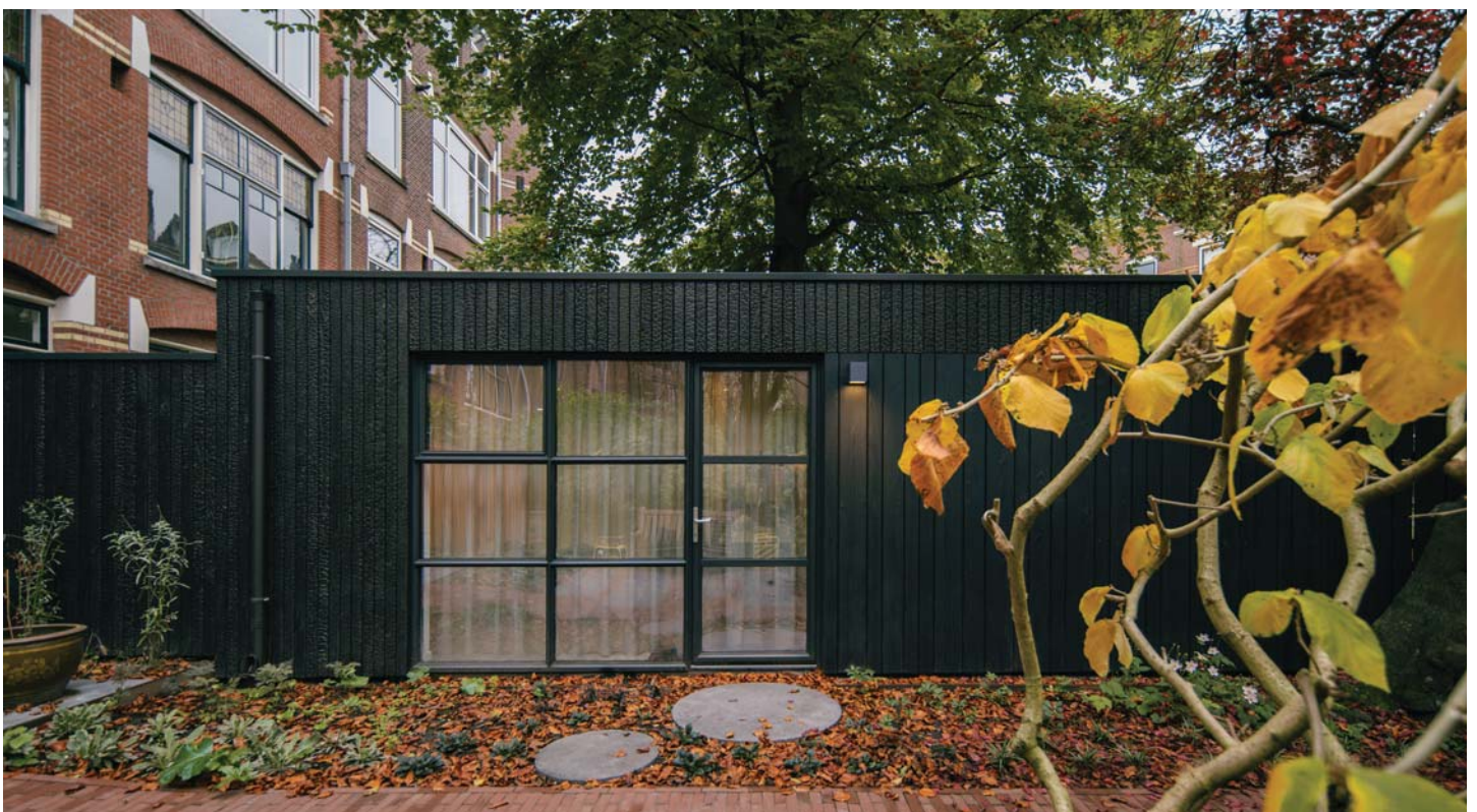
DE TUINSTUDIO WORDT BENADERD VIA STEPPINGSTONES, WAT HET GEVOEL VAN ISOLATIE VERSTERKT EN TEGELIJKERTIJD DE RELATIE MET DE TUIN BENADRUKT.

DUURZAAMHEID Duurzaamheid staat centraal in dit project, met een sterke focus op herbestemming door het gebruik van de bestaande constructie. De tuinstudio maakt gebruik van gedeeltelijk steen en houtskeletbouw (HSB), evenals een houten dak, waardoor de ecologische voetafdruk van het gebouw aanzienlijk wordt verkleind. De gevels zijn eveneens uitgevoerd in hout, wat ook de natuurlijke uitstraling van de tuinstudio versterkt. De rode klinkers zijn hergebruikt van de oudere tuin en zijn verwijderd, omgevormd en schoongemaakt. De beplantingskeuze en uitbreiding van onverharde onderdelen in de tuininrichting bevorderen de biodiversiteit en klimaatbestendigheid.