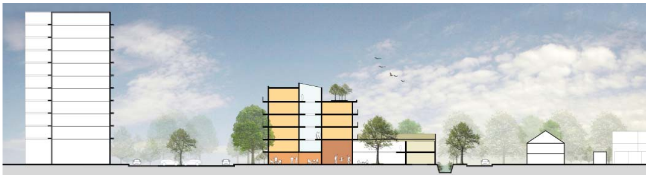
PROFIEL 2 MET DE DANSSTUDIO AAN DE ZOMER-PATIO