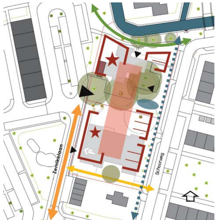
UITGANGSPUNTEN NIEUWE BEBOUWING

AMBITIES De nieuwe zorgvoorziening vraagt om een volume dat enerzijds reageert op de hoogbouwflats langs de Zernikelaan en anderzijds aansluit op de schaal van de grondgebonden woningen met een kap langs de Schoorweg. De hoofdentree komt aan de zijde van de flats maar ook vanuit de wijk is een tweede entree voorzien. Voor de locatie is een bomeninventarisatie gedaan en de meest waardevolle bomen worden in het plan geïntegreerd. De historische