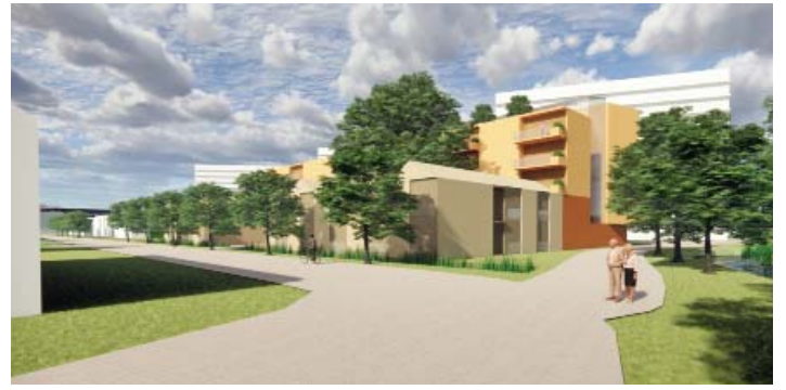
OOGHOOGTE VANAF HENRI DUNANTSINGEL