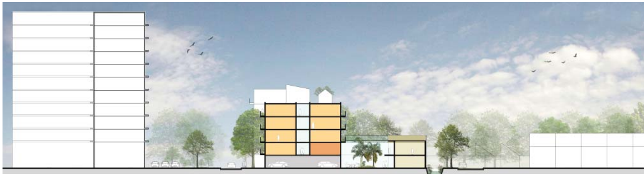
PROFIEL 1 MET DE PARKEERGARAGE AAN DE WINTER-PATIO