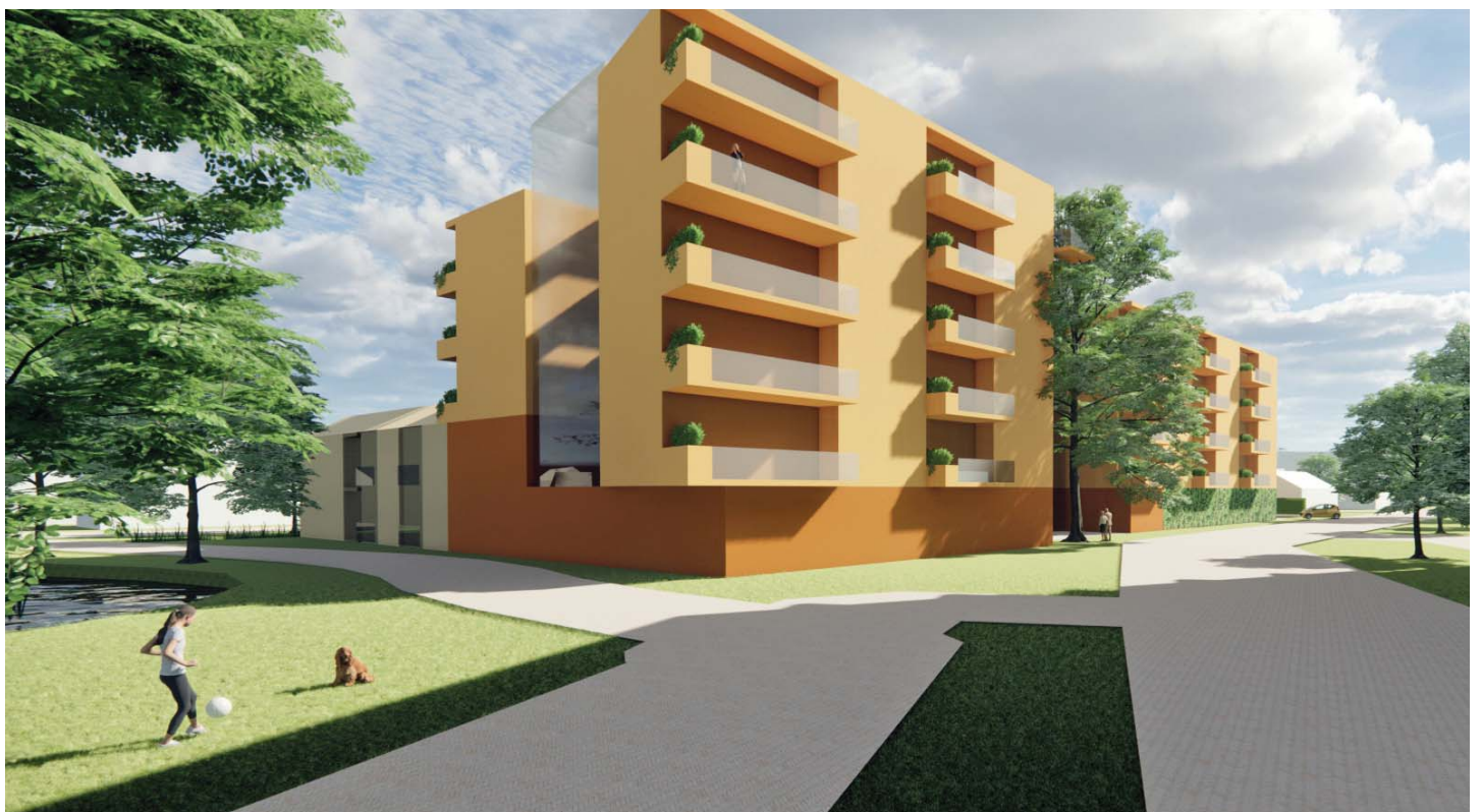
OOGHOOGTE VANAF NOORD-WEST ZIJDE